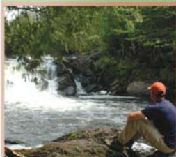
Chutes, Les Sept Lacs