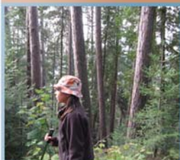
Pinède rouge à pin blanc, Montagne à Fourneau

Le Sentier national au Bas-Saint-Laurent traverse trois environnements bien distincts sur le plan physiographique : le littoral et les basses terres du Saint-Laurent, la région des hauts plateaux et le secteur des monts Notre-Dame au Témiscouata.