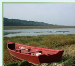
Les battures, Littoral basque