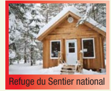
Refuge du Sentier national