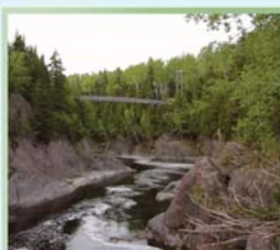
Passerelle basque, Rivière des Trois Pistoles