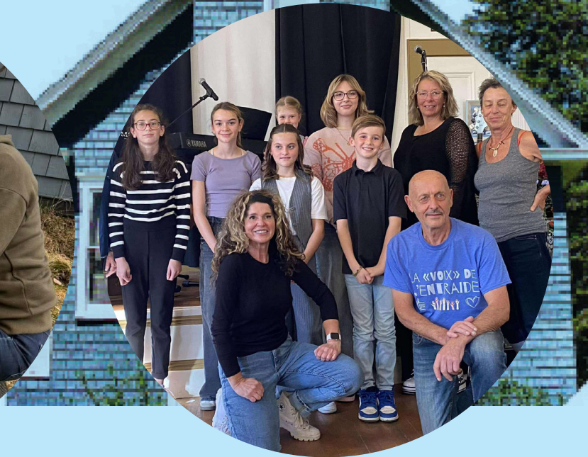
Les participants du micro ouvert 2025