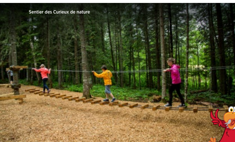
Sentier des Curieux de nature

Sentier pédestre le plus populaire du parc , la Montagne du Fourneau est composée d'un écosystème forestier exceptionnel (pinède rouge à pin blanc). Ce sentier vous permet d'atteindre des points de vue enchanteurs sur le lac Témiscouata. Une randonnée guidée est offerte.