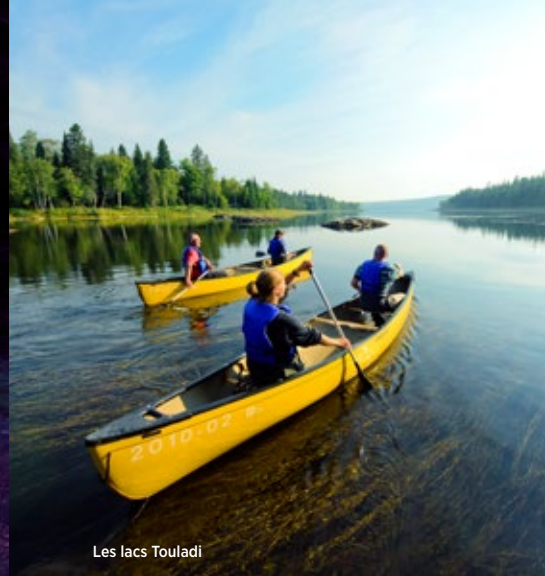
Les lacs Touladi

Participez à nos activités de découverte !