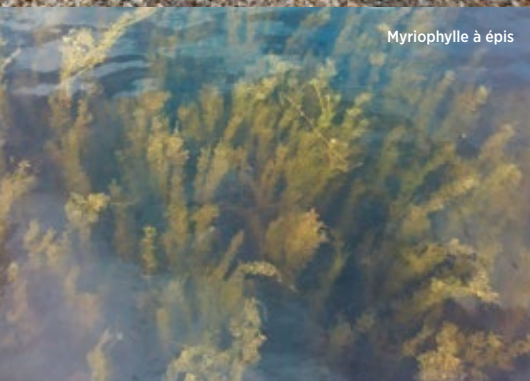
Myriophylle à épis