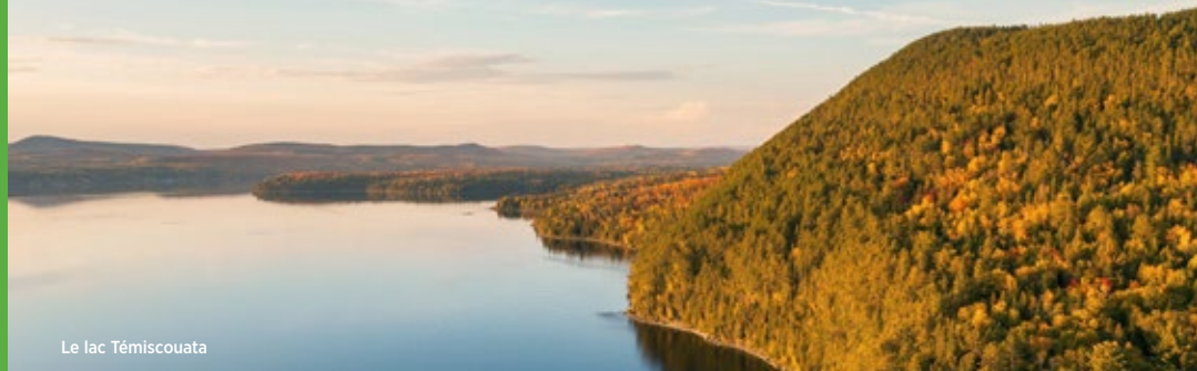
Le lac Témiscouata