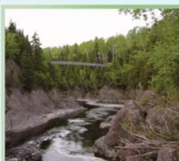
Passerelle basque, Rivière des Trois Pistoles