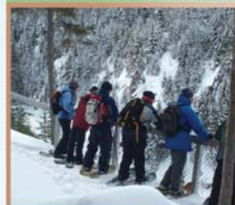
Les trois saults, Sénéscoupe